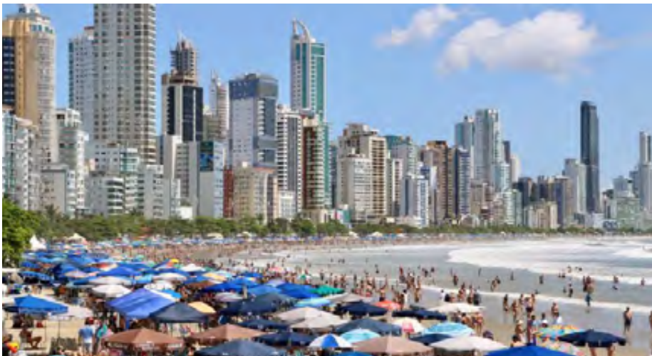
Figura n.º 4 Praia Central de Balneário Camboriú (janeiro de 2020)

Em reportagem de 20 de fevereiro de 2020 13 , do jornal digital O Janelão , assinalava-se o aumento do turismo em Balneário de Camboriú em comparação com os anos anteriores, sendo a maior porcentagem de brasileiros, com presença marcante dos argentinos e em melhor número de uruguaios, paraguaios e chilenos.