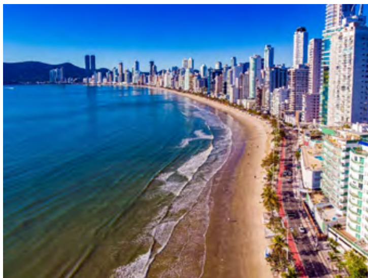
Figura n.º 2 Balneário Camboriú (2021)