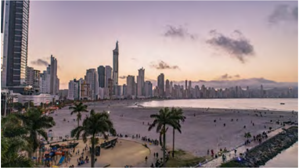
Figura n.º 3 Vista de Balneário Camboriú, Santa Catarina, Brasil 2021